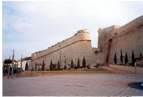
Vista del flanco, desde la plaza Reina Sofia

La normativa que sirve de marco legal para las actuaciones en el casco histórico de Dalt Vila, es el Plan Especial de Protección y Reforma Interior, aprobado definitivamente el 27 de marzo de 1997.