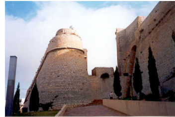
Orejón del baluarte de San Pedro