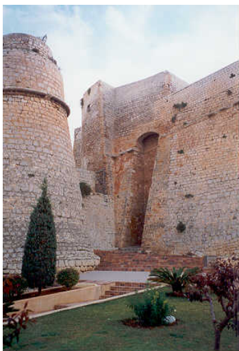
Izquierda: recrecido del parapeto y Caballero de San Lucas.

Las obras del baluarte de San Pedro, se pueden considerar finalizadas en el año 1597 con el levantamiento del caballero de San Lucas, conservando fundamentalmente su aspecto hasta nuestros días y contando con solo pequeñas reformas producto de su mantenimiento en el transcurso del tiempo.