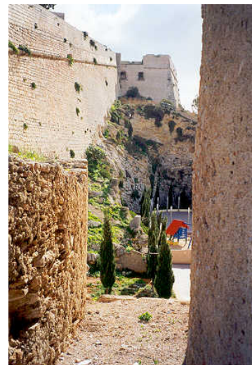
Derecha: vista del lienzo de muralla recrecido entre los baluartes de San Pedro y Santiago